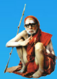
గురు చంద్రశేఖర పరమాచార్య